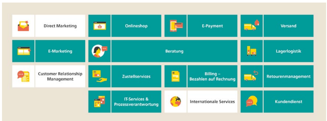
Abb.: Für alle grün hinterlegten Leistungen vertraut Dr. Oetker auf die Post.